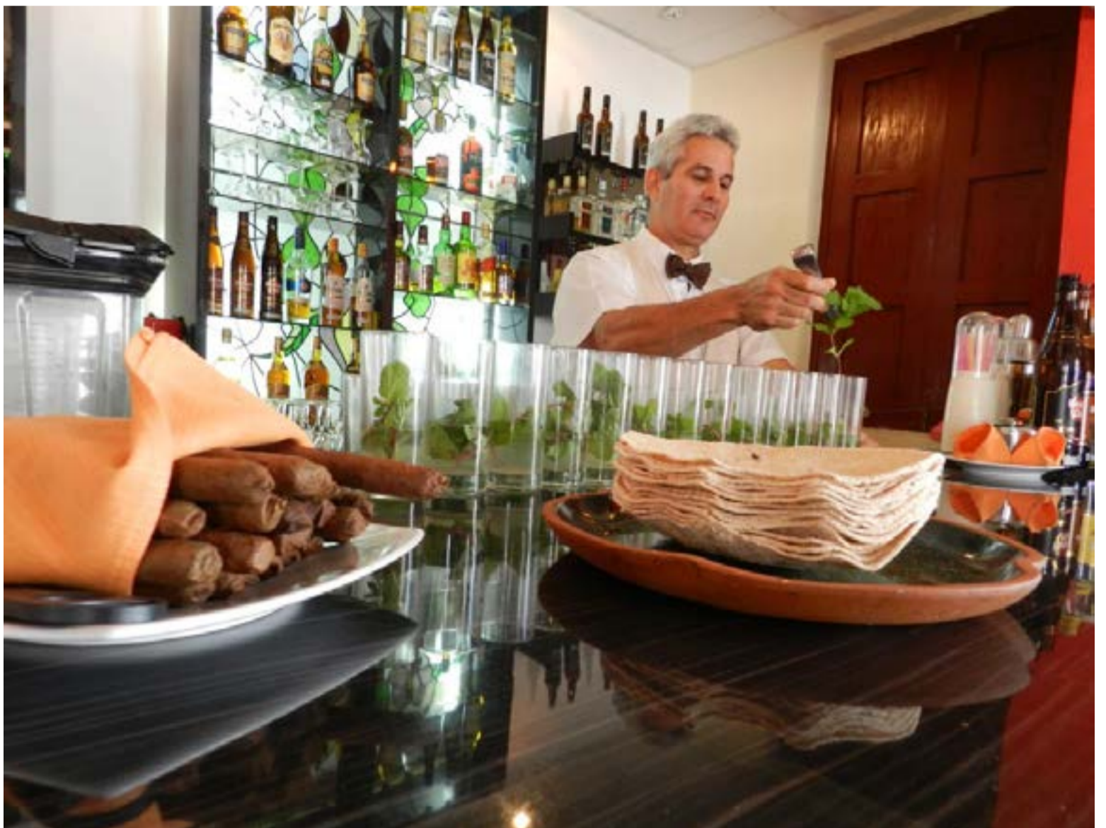
Casabe presente en el restaurante El Paso

Se asocia de igual forma con el casabe el plato típico Mata Jíbaro, fufú de plátano (pintón y verde), con empellas de cerdo y