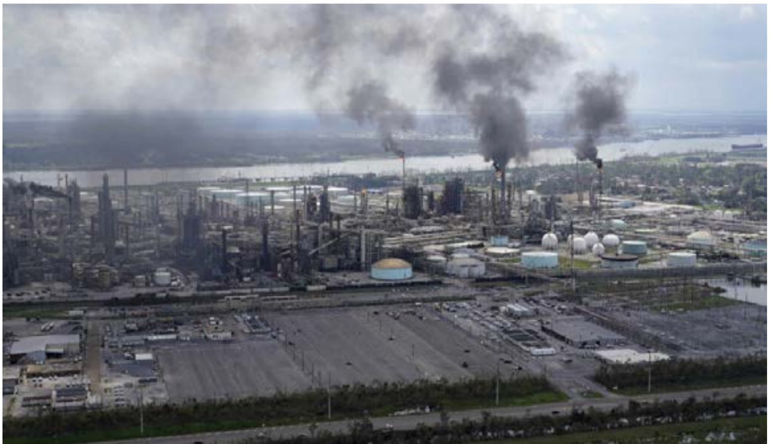
Una grave crisis ambiental por incendios forestales e inversión térmica cubre de aire tóxico a Estados Unidos, obligando a millones de ciudadanos al confinamiento. Las regiones más afectadas abarcan desde California, Oregón y Washington en la Costa Oeste, hasta Nueva York y Chicago en la Costa Este.

El detonante científico de esta parálisis urbana son las partículas ultra finas conocidas como PM2.5. Al tener un diámetro inferior a los 2.5 micrómetros, estos elementos eluden los filtros naturales del sistema respiratorio humano y penetran directamente en el torrente sanguíneo. La peligrosidad del fenó-