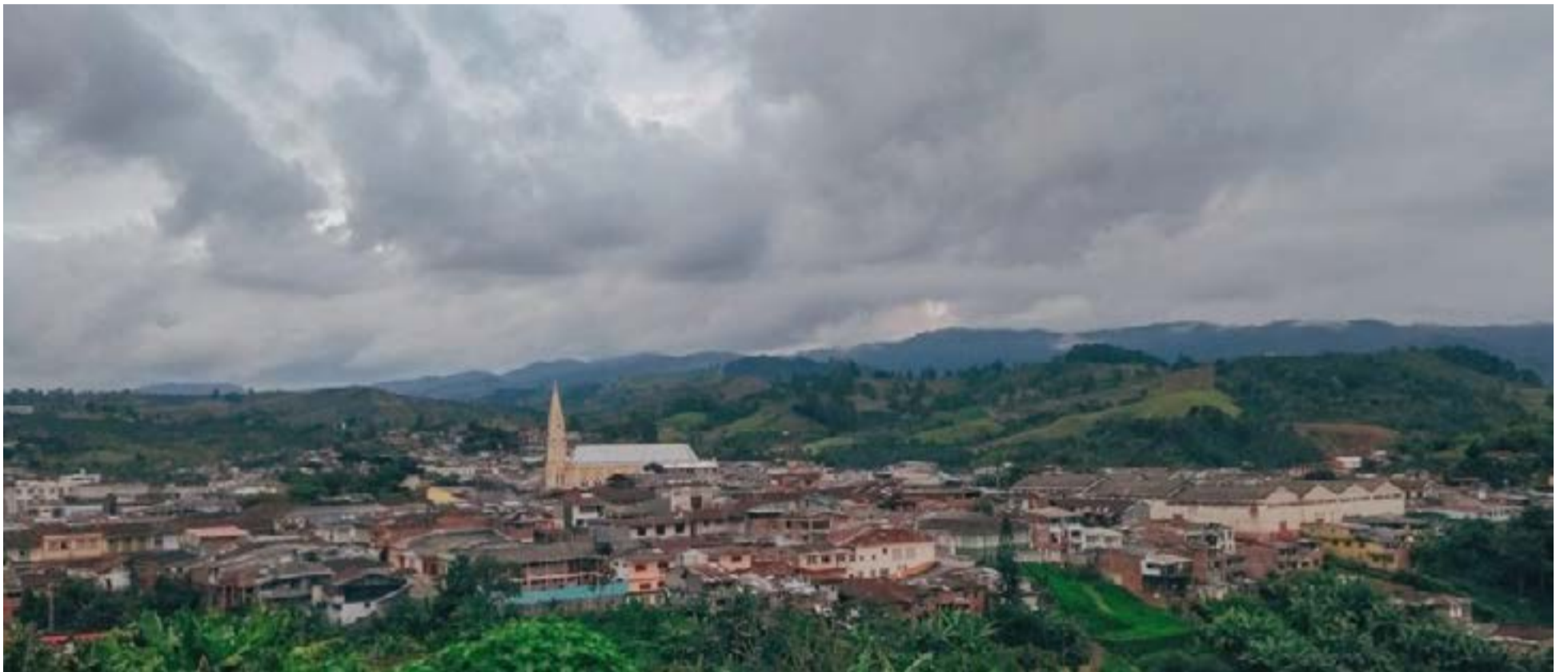
Sevilla Valle del Cauca