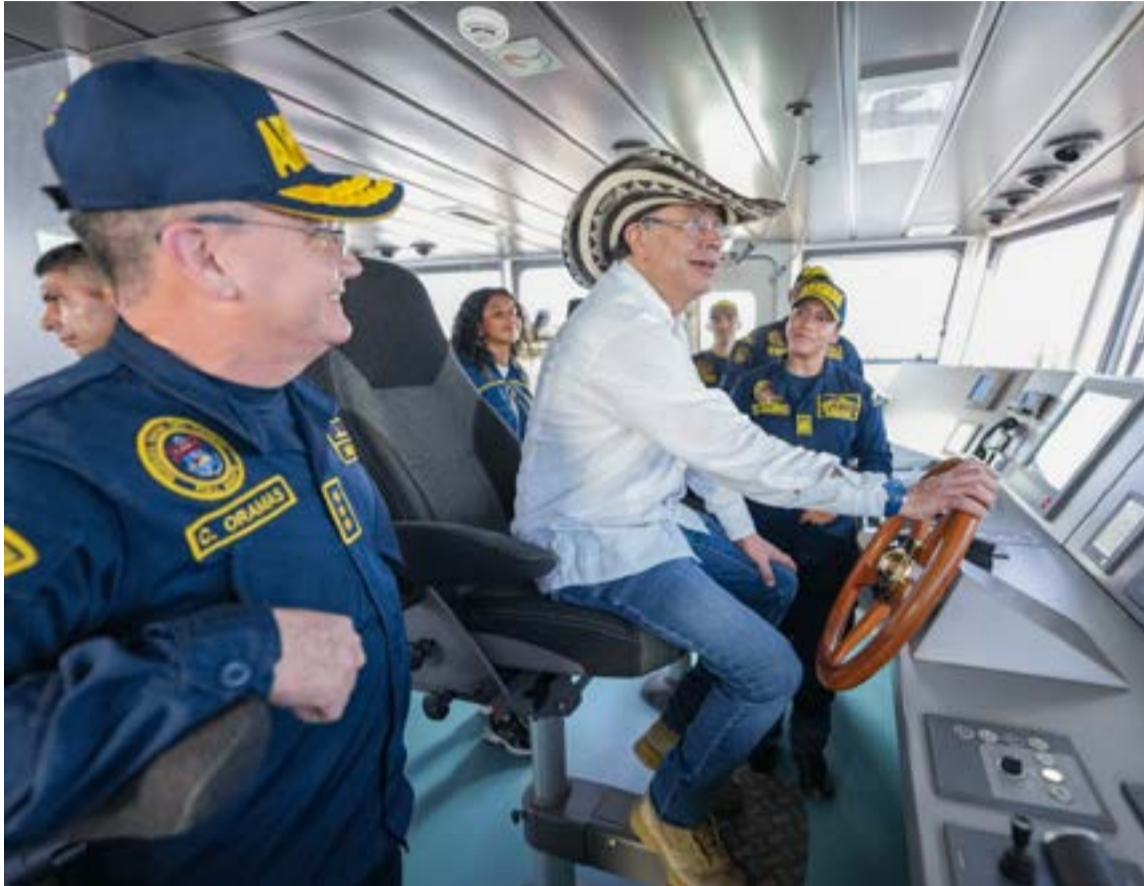
La embarcación ha sido adecuada con tecnología y espacios logísticos avanzados para garantizar una respuesta integral en zonas de difícil acceso.