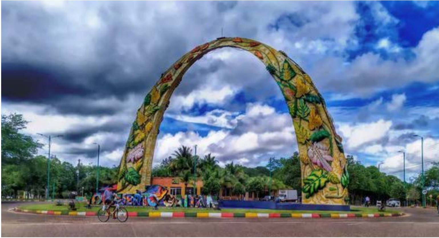
Puerto Gaitán y su símbolo el Arco

otra llanura extensa de Colombia. Tripulantes y pasajeros hacen una parada para tomar el curso del río Cravo Sur, afluente valioso del Meta. De aquí en adelante, el cuidado de los pilotos es extremo por los numerosos bajos (montes de arena que no se ven) que presenta el río. Tropezar con uno de estos puede causar un accidente irremediable.