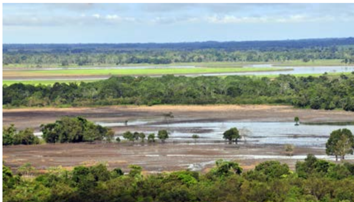
El amanecer en el llano se vuelve infinito, uniendo el cielo y la tierra en una línea dorada donde el día estalla en libertad. Este «Amanecer Dorado» no es un cambio de horario, sino el reflejo poético de una naturaleza que demuestra su absoluto esplendor.

A medida que la luz avanza, el Llano cobra vida con una sinfonía única y salvaje.