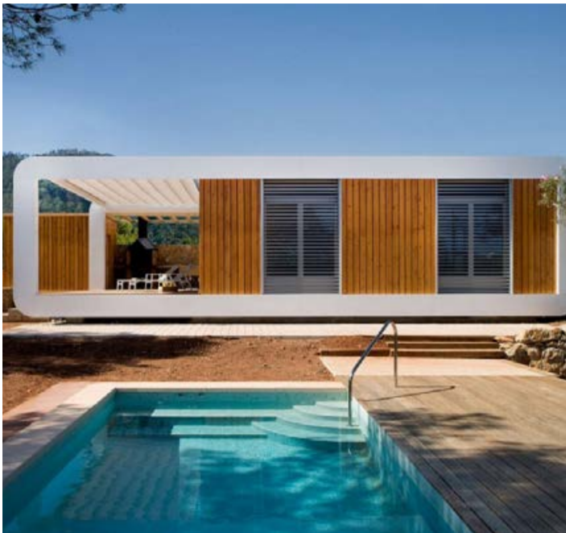
La primera casa autosuficiente sin facturas de agua ni luz se ha hecho realidad y se perfila como la vivienda del futuro

La casa obtiene la energía de fuentes renovables, tiene sistemas de energía fotovoltaica, so-