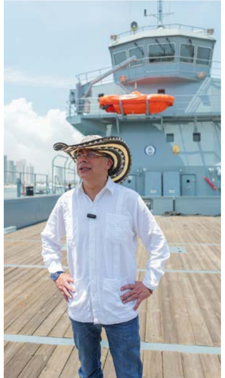
Centro de Operaciones Flotante: Servirá como puesto de mando unificado (PMU) en el mar o los ríos, facilitando la coordinación entre la UNGRD, la Armada Nacional, la Defensa Civil y la Cruz Roja en tiempo real durante una emergencia.