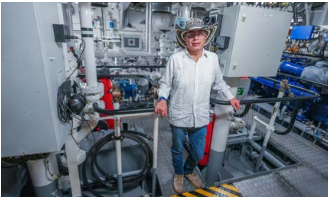
El buque operará como una plataforma de justicia social y ambiental, permitiendo conectar de manera eficiente las capacidades del Gobierno Nacional con el litoral Pacífico, la costa Caribe y las principales arterias fluviales del país.