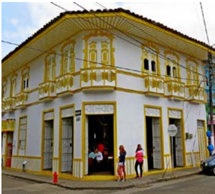
«Casablanca», en Sevilla Valle del Cauca

que había que enmarcarlas y colgarlas en mi café. El problema era que tenía muchas fotos de Gardel, pero pensé que se convertiría en un desaire desear algunas de ellas que con tanto afecto me habían regalado. Opte por enmarcarlas todas y colgarlas, por eso es que hay tantas fotos de Carlos Gardel en Casablanca. La primera que me obsequiaron la trajeron de Tacuarembó, una ciudad Uruguaya en la que, algunos dicen, nació Carlos Gardel».