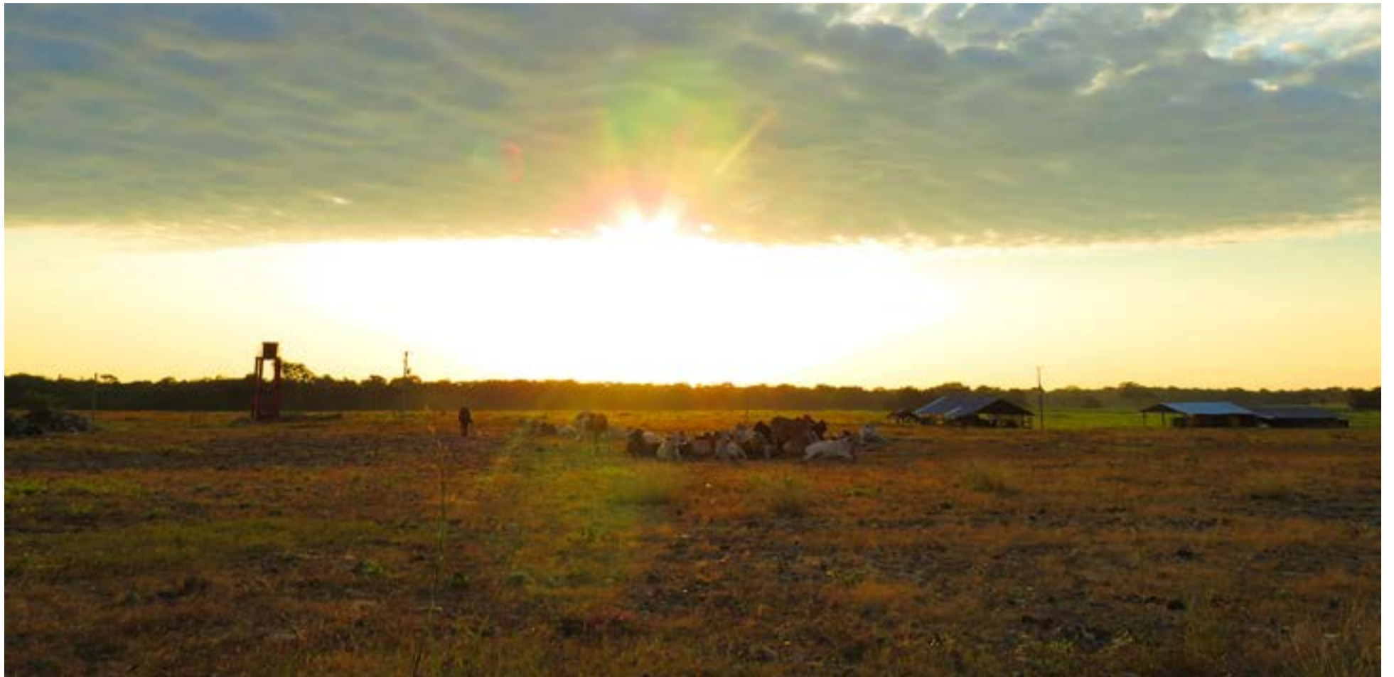
El sol despunta majestuoso sobre las vastas llanuras del oriente colombiano, tiñendo de oro el horizonte en Aguazul, Casanare.