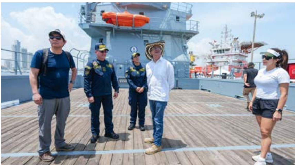
Su diseño permite el transporte masivo de asistencia humanitaria de emergencia (kits de alimentos, agua potable, carpas y herramientas) hacia zonas afectadas por inundaciones, huracanes o sequías.